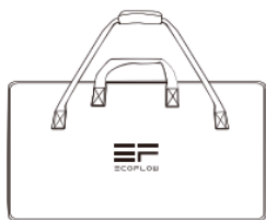
Mallette de protection et support